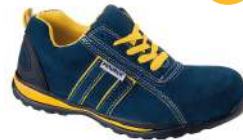
Deportiva seguridad Seward