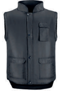
Chaleco multibolsillos negro