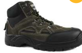
Bota seguridad Tiberina