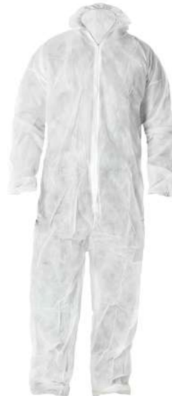
Buzo monouso polipropileno

Talla 48: CÓD. 15020800 Talla 50: CÓD. 15020805 Talla 52: CÓD. 15020810 Talla 54: CÓD. 15020815 Talla 56: CÓD. 15020820 Talla 58: CÓD. 15020825 Talla 60: CÓD. 15020830 Talla 62: CÓD. 15020835 Talla 64: CÓD. 15020840 Talla 66: CÓD. 15020845