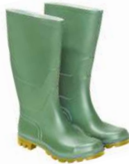
Botas goma altas verdes