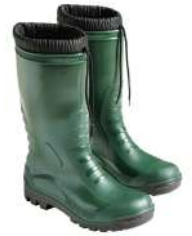
Botas goma altas verdes invierno 80