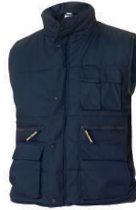
Chaleco multibolsillos azul

Talla L: CÓD. 15010037 Talla XL: CÓD. 15010038 Talla XXL: CÓD. 15010039