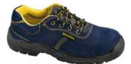
Zapato seguridad transpirable Zeus