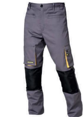
Pantalón trabajo gris y amarillo largo