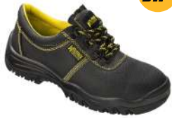
Zapato seguridad piel negra