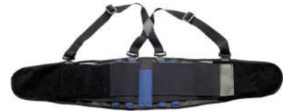
Faja lumbar con tirantes

Talla L: CÓD. 15020730 Talla XL: CÓD. 15020735 Talla XXL: CÓD. 15020740