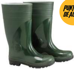
Botas goma altas verdes seguridad