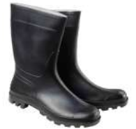
Botas goma bajas negras