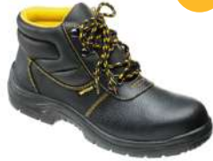
Bota seguridad piel negra