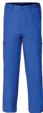
Pantalón trabajo azul